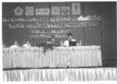
นำเสนอผลงานทางวิชาการ สปสข เมืองทองธานี