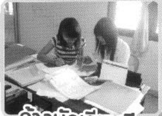
จ้างนักเรียนศึกษา ทำงานปิดภาคเรียน