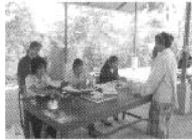
ให้บริการประชาชนนอกสถานที่