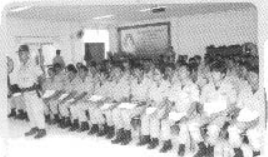
อบรม อบพร.