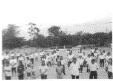
เดินแอโรบิค 52