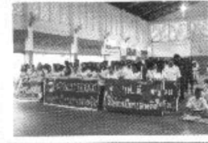
รณรงค์ต่อต้าน ยาเสพติดโลก