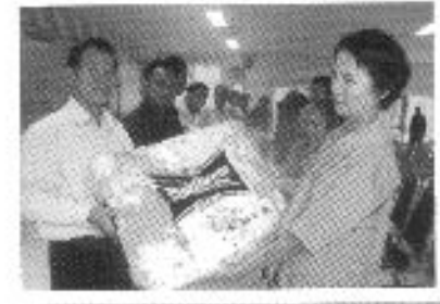
มอบผ้าห่มกันหนาว