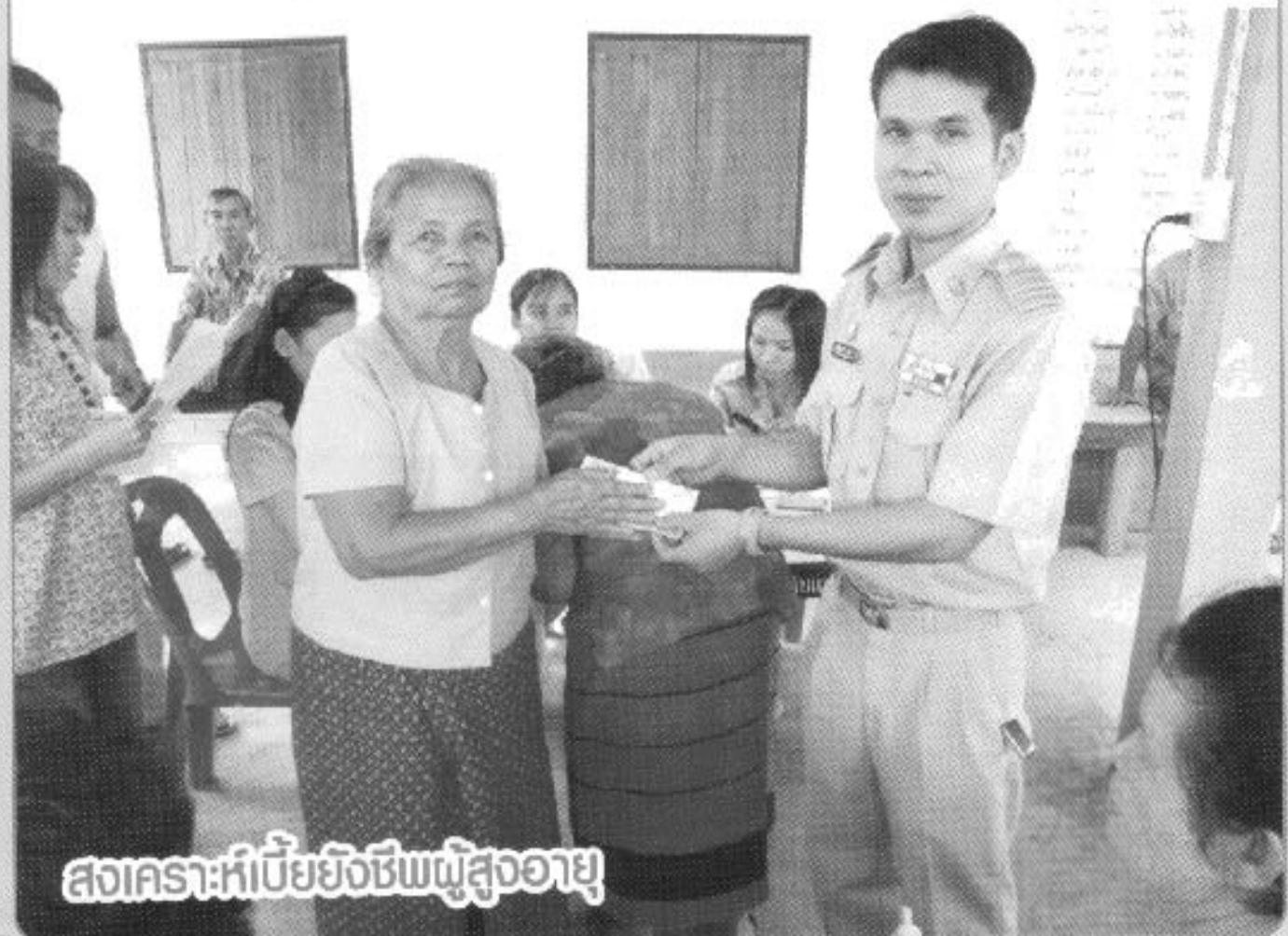
สงเคราะห์เบี้ยยังชีพผู้สูงอายุ