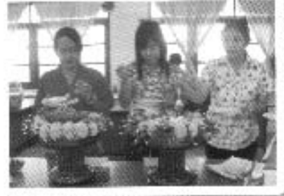
ประกวดเมมเบอซูสภาพ