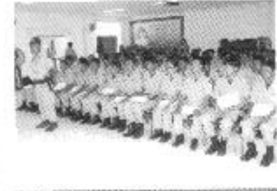
อบรม อปพร.