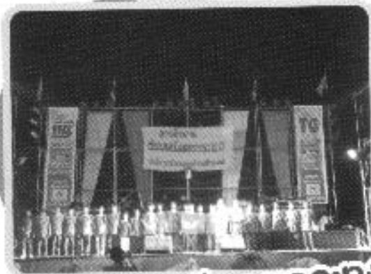
จัดงานประเพณีลอยกระทง