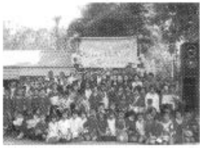
วันเด็กแห่งชาติ