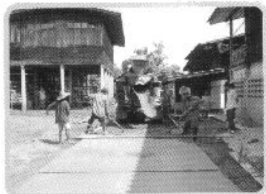
ก่อสร้างถนนหมู่บ้าน