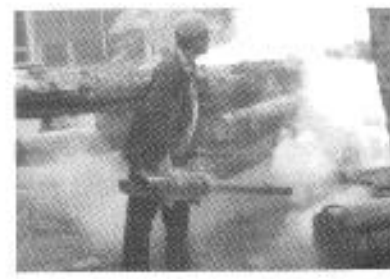
ตัดพ่นหมอกควีนกำจัดยุงลาย