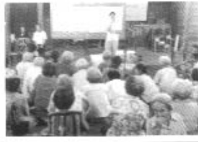
ประชามหมู่บ้าน