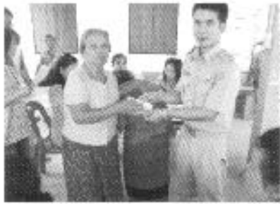
สงเคราะห์เบี้ยยังชีพผู้สูงอายุ