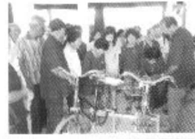
ประกวดนวัตกรรมผู้สูงอายุ