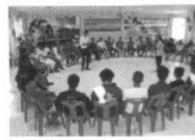
เยาวชนสัมพันธ์ ต้านยาเสพติด