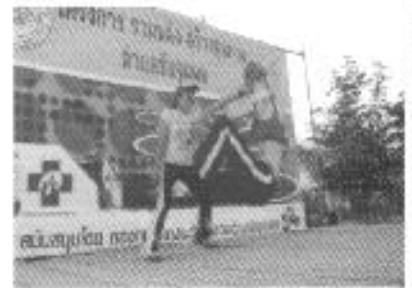
แอโรบิคเพื่อสุขภาพ

รางวัลกองทุนหลักประกันสุขภาพดีเด่น ระดับจังหวัด จาก สปสช.