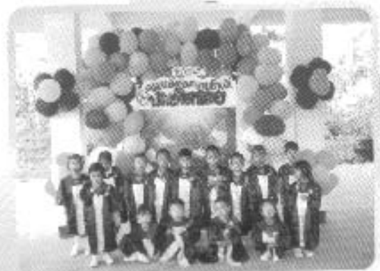
โครงการบัณฑิตน้อย