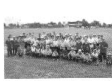
ปลูกต้นไม้ลดภาวะโลกร้อน