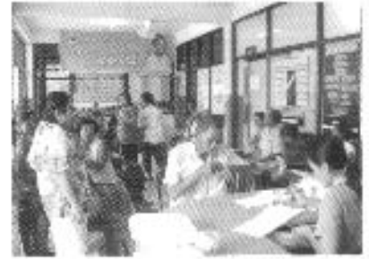
คัดกรองผู้ป่วยโรคเรื้อรัง