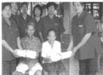
อาสาสมัครดูแลผู้สูงอายุที่บ้าน