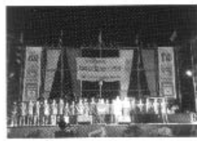
ปะเพณีลอยกระทง