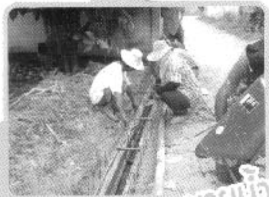
ก่อสร้างรางระบายน้ำ