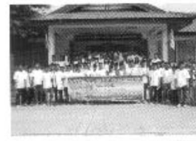
เยาวชนสัมพันธ์ ต้านยาเสพติด ฐานลำปาง